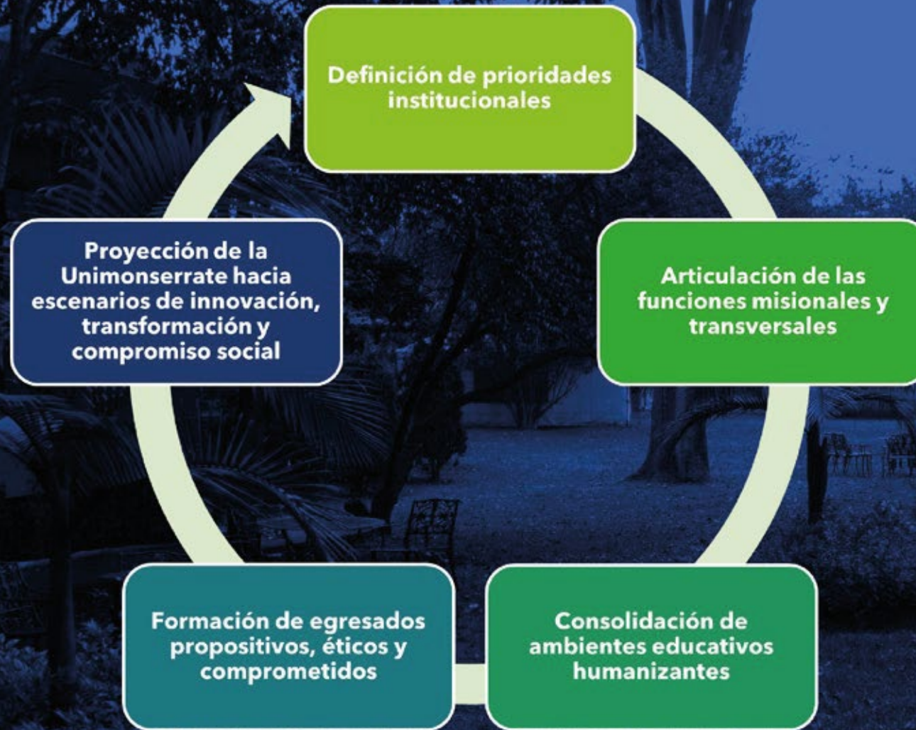
Figura 1. Alcance del PDI 2026-2030 "Fortaleciendo la calidad, proyectando el futuro)

Fuente: (Fundación Universitaria Monserrate, 2025)