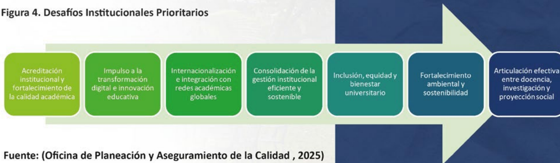
Figura 4. Desafíos Institucionales Prioritarios