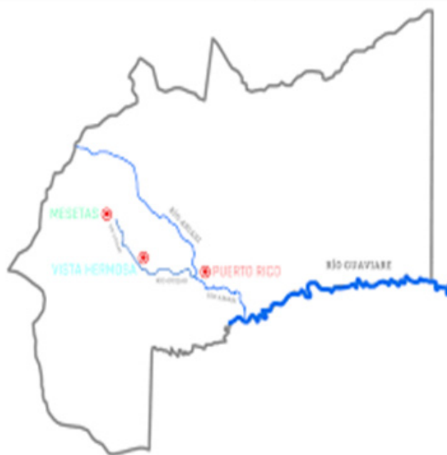
Ilustración 12 Zona Río Ariari Elaboración propia.

desapariciones forzadas, masacres, ejecuciones extrajudiciales conocidas como “falsos positivos”, desplazamientos forzados, detenciones masivas y fumigaciones a cultivos de pancoger y demás violaciones a los Derechos Humanos.