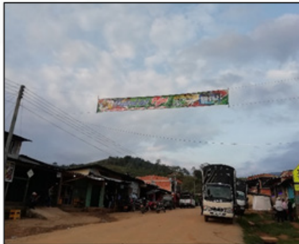
Ilustración 8 Festival del Frijol (Febrero 2019) Registro fotográfico propio.

“Si, claro, y es que haí pues uno puede nombrar, a mí me gustaría muchísimo trabajar con el festival de retorno como un elemento de convivencia, no centrarnos en el festival porque pues por temas de tiempo no vamos a poder estar en el festival, no vamos a poder. Nosotros tenemos unos derechos, si no que eso también hay que de alguna manera mostrarlo, y ahora y que eso no ha sido gratis, y que aquí las experiencias de paz en el territorio del pasado porque tiene mucho que ver con esto. Del proceso de paz eso hasta los mismos curas se han beneficiado...” (Miembro AMCOP, (Comunicación personal, 25 de enero de 2019).