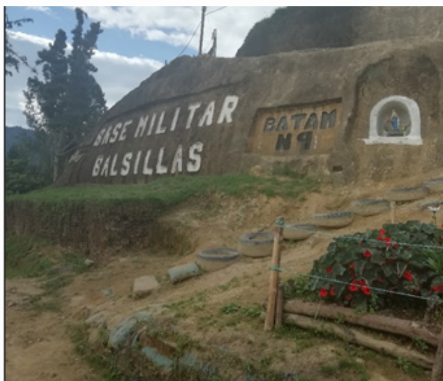
Ilustración 5 Batallón Militar de Alta Montaña, ubicado en Balsillas.

“Nosotros, hay que darle importancia, porque esta es una región que para todos los que hayan escuchado o hayan tenido que ver algo allá lejos, por allá con el Pato, pues saben que de aquí las FARC nunca se fueron, no se han ido, han estado en movimiento político, que no salieron, eso ¿qué significa? y es que mientras en algunas regiones la salida de las FARC significó la llegada de problemas en el territorio de nosotros, hablemos claro,