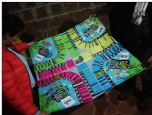
Ilustración 9 Material pedagógico “Historia del Pato”